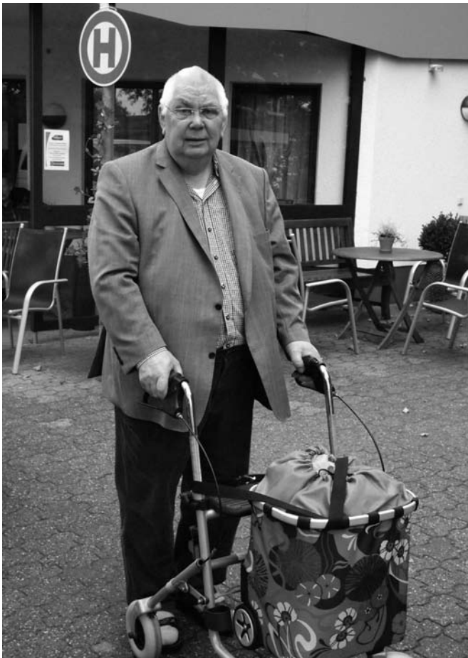
Der erste Einkauf mit dem neuen Service

Im Rahmen der Tagung „Zukunftsperspektiven und strategische Ausrichtung des Clarenbachwerkes“ zum Thema: „Gut alt werden – was ist dafür notwendig“ wurde unter zahlreichen Arbeitsgruppen auch die AG-Mobilität ins Leben gerufen. Die setzte sich zur Aufgabe, mobilitätsfördernde Maßnahmen zu entwickeln. Sprich, es sollten Anreize für mehr Mobilität geschaffen werden.