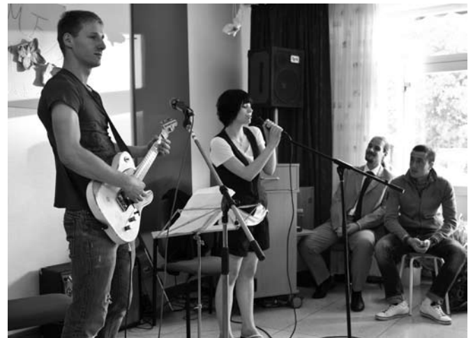
Der Kurs 25 hatte die Abschlussfeier sehr schön und stimmungsvoll gestaltet!