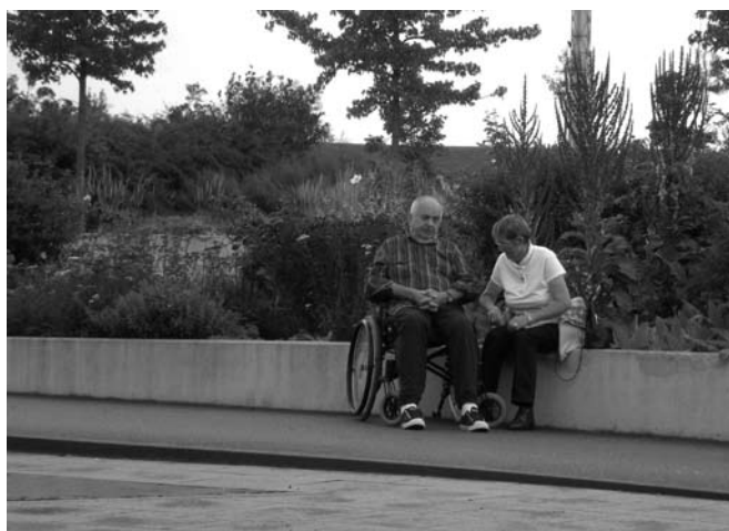
Ein schönes Naherholungsgebiet ist der Neulandpark

Auf Grund der Wechselflora, die sich den Jahreszeiten anpasst, lohnt sich ein Besuch im Park bei jedem Wetter und zu jeder Jahreszeit. Am 2. Januar 2006 öffnete der Neuland-Park seine Pforten. Auf dem Gelände der ehemaligen Landesgartenschau Leverkusen ist für Bürger und Gäste der Stadt Leverkusen ein Naherholungsgebiet geschaffen worden, das für jeden etwas bietet. Schon zu Zeiten der Gartenschau – vom 16.04. bis 09.10. 2005 – war die „LAGA“ ein Publikums-magnet und zog rund 550.000 zahlende Besucher an. Diese neue Grünfläche, die Leverkusen wieder an den Rhein zurückbringt, ist etwas Besonderes. Nicht in einem vorhandenen Stadtpark mit jahrhundertealten Eichen, sondern auf dem Gelände der abgedichteten Altlast Dhünnaue Mitte, direkt am Rhein gelegen, unterhalb der Autobahnbrücke A1, in direkter Nachbarschaft zur imposanten Industriekulisse der Bayer AG.