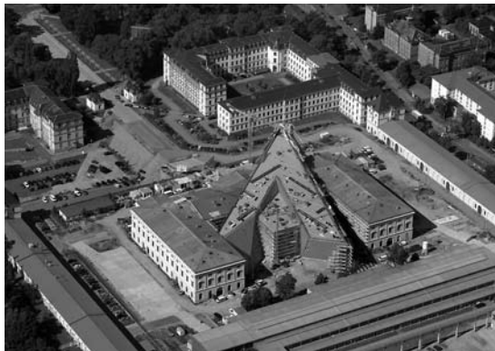
Das Militärhistorische Museum stellt nicht stolz Kriegsgerät aus, sondern bietet eine Mentalitätsgeschichte der Gewalt. Unbedingt sehenswert wie die Architektur von Daniel Libeskind!

pflegten mehr Kontrolle über die Pflege zugestanden wird und er neues Vertrauen zur Pflegekraft fassen kann. Im Idealfall gibt es bereits eine verlässliche und stabile Beziehung zwischen Pflegebedürftigem und Pflegekraft, jedenfalls sollten Vertrauenspersonen die Pflege durchführen. Ob die von ihren Erinnerungen geplagte Person ihr Erlebnis erzählt, sollte man unbedingt ihr selbst überlassen. Manchmal vertrauen sich Menschen mit solchen Erlebnissen eher neutralen Personen an als der eigenen Familie, hilfreich kann auch das Einschalten eines Psychologen oder eines konfessionellen Seelsorgers sein, wenn die Betroffenen das wünschen.