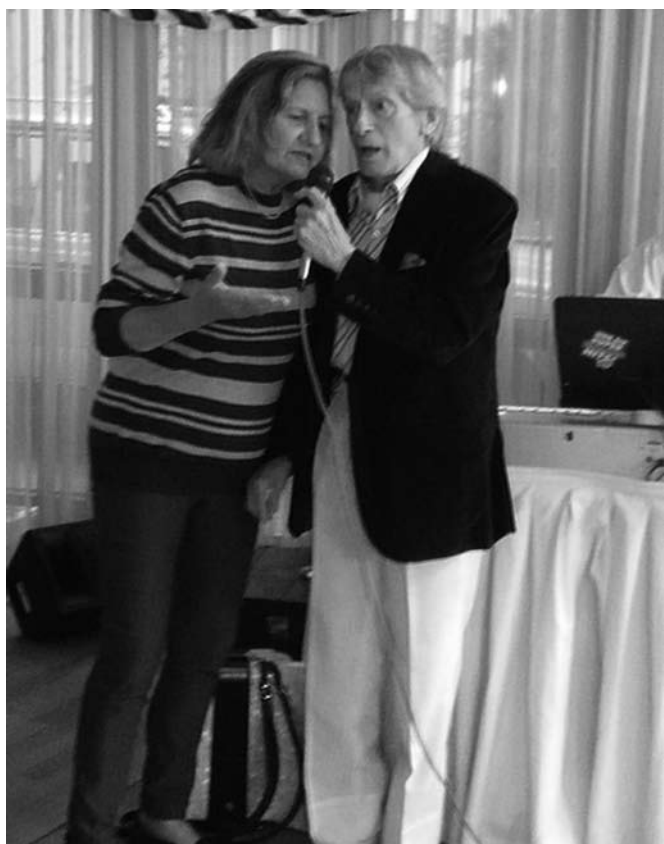
Auf dem Herbstfest wurde mitgesungen und sogar das eine oder andere Tänzchen gewagt (siehe rechts)

Bierkrüge füllten sich mit Weizenbier und wurden an die vollbesetzten Tische gestemmt. Der Kölner – an den Gebrauch der leichten Kölschstange gewöhnt – musste nun seine Muskelkraft unter Beweis stellen. Dazu durfte natürlich auch das bayerische Traditionssessen – Schweinshaxe mit Sauerkraut und Knödeln – nicht fehlen. Ein Dank an dieser Stelle an die Hauswirtschaft, die sehr „kundenorientiert“ arbeitete und sich auf Minihaxen beschränkte. So fand denn auch nach dem Essen die ein oder andere duftende Laugenbrezel noch ihren Abnehmer.