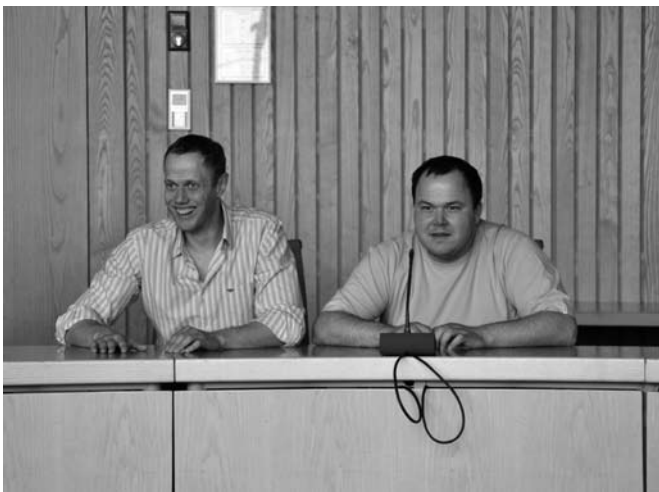
Zwei Kursteilnehmer probieren die Bänke im Landtag aus

der Altenpflege (und der Pflege im Allgemeinen), wie etwa einen Gesundheitscampus in Bochum. Außerdem plant Bayern zurzeit die Einführung einer Pflegekammer. Zitat Herr Watzlawick: „Die Altenpflege steckt noch in den Kinderschuhen und wir haben einen weiten Weg vor uns (...), aber die ersten Ergebnisse sind durchaus sehr vielversprechend!“