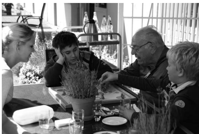
Hier haben alle Spaß!