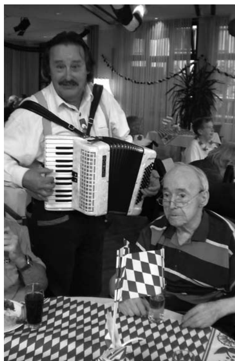
Schöne Dekoration, aber vor allem gute Musik und Stimmung beim Herbstfest

„O' zapft is“ war das Motto am 5. Oktober im Haus Andreas. Und was sich dahinter verbirgt, war auch allen Nicht-Bayern schnell klar: Der Speiseraum hatte sich in ein großes Bierzelt verwandelt. Blau-weiße Girlanden und Luftballons prangten da, wo vorher zartes Herbstlaub die Saaldecke schmückte. Auch den Tischen stand die blau-weiße Dekoration gut.