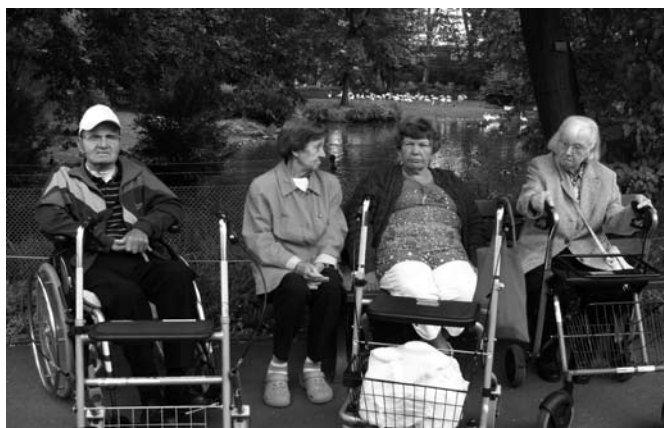
Eine Pause muss sein!

chen. Dort konnte man im letzten Jahr um die dreißig Erdmännchen und Erdfrauen bewundern, jedoch in diesem Jahr waren nur vier Stück zu sehen. Wir fragten uns natürlich, wo sich die Erdmännchen versteckt hatten und fanden den Grund bei genauerem Hinsehen sehr schnell, denn im Gehege lag ein leeres 10 Liter Bierfässchen.