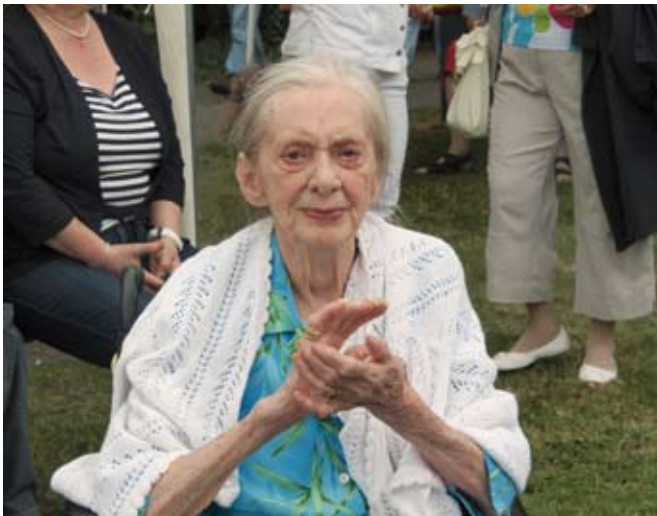
Für die Auftretenden gab es viel Applaus...