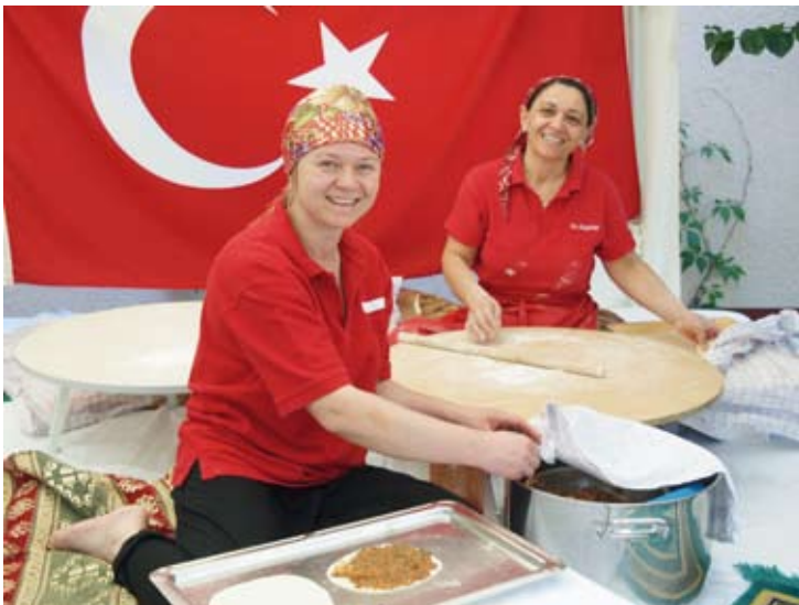
Dagegen sind die Kochshows im TV kalter Kaffee: die Küche des Haus Andreas stellte ihre köstlichen Lahmacun live her!