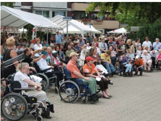
Und so sah es vor der Bühne aus