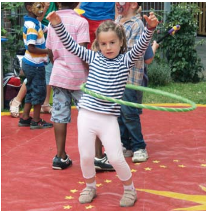
„Fast ein Testbild“, jedenfalls die ersten Farbfotos (nach dem Titel) in der Clarenbach Aktuell. Vor allem aber sind es zwei tolle Fotos vom Sommerfest (Artikel und weitere Fotos unten)

Heute halten Sie, liebe Leserinnen und Leser, die erste farbige Ausgabe unserer Clarenbach-Aktuell in den Händen. Es handelt sich zunächst einmal um einen Probelauf.