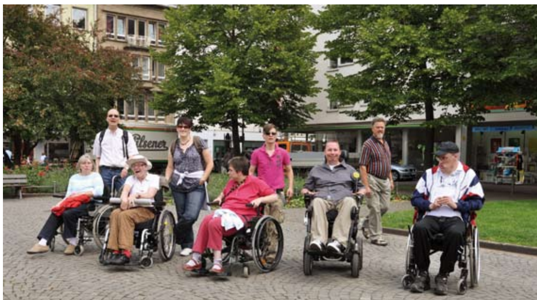
Eine Ausflugsgruppe in der Koblenzer Innenstadt

wir die lange Warteschlange umgehen. Es waren zwar noch keine Schulferien, aber der Andrang war schon sehr enorm. Viele Busse aus dem In- und Ausland parkten zu der sehr frühen Stunde auf dem Busparkplatz.