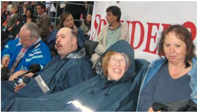
Regenkleidung war auch unter dem Stadionsdach unverzichtbar