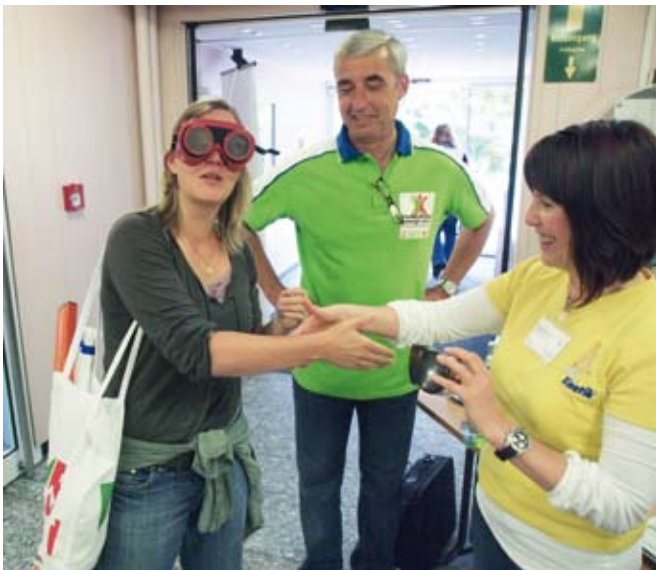
Sogar das Händeschütteln wird zum Problem mit der Brille, die verschiedene Grade des Alkoholisiertseins simuliert

Bechern angerichtet ist, über einen Hörtest, Rücken- und Fußmessung, Venendruckmessung bis zur Einführung in Feldenkrais, Vorträge über Life Kinetik, Akupunktur oder Vorsorgeuntersuchung bis hin zur Massage. Bei so viel Programm also keine Zeit verlieren und los zur ersten Station. Fast stolpert man vorher über einen Tisch der Barmer Ersatzkasse. Die merkwürdigen Brillen, die darauf liegen, entpuppen sich als Rauschbrillen, die den Seh- und Gleichgewichtszustand bei verschiedenen Promillestadien simulieren sollen, werden wir von den jungen Barmer-Mitarbeitern aufgeklärt. Erschreckend, dass man mit 0,8 Promille kaum noch einen Stift auf Anheiß greifen, geschweige denn mit angemessener Grazie jemandem die Hand geben kann.