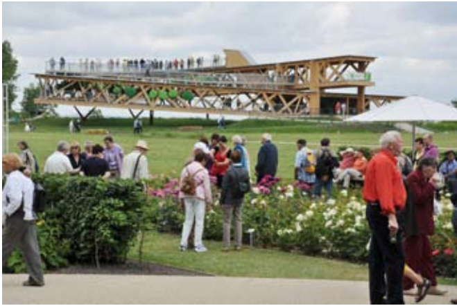
Ein Blick auf die Aussichtsplattform auf dem Gelände der Burg Ehrenbreitstein

Es gibt für Rollstuhlfahrer oder gehbehinderte Menschen und Familien mit Kinderwagen eine große Kabine (Nr. 18), die problemlos mit Rollstühlen zu besteigen ist. Man braucht zirka fünf Minuten für eine Fahrt. Im Eintrittspreis ist eine Hin- und Rückfahrt bereits enthalten. Man kann Hin- und Rückfahrt direkt verbinden, aber auch ganz beliebig von einander trennen. Am Deutschen Eck gibt es einen schönen und großen Biergarten, und man ist auch schnell in der Koblenzer Altstadt.